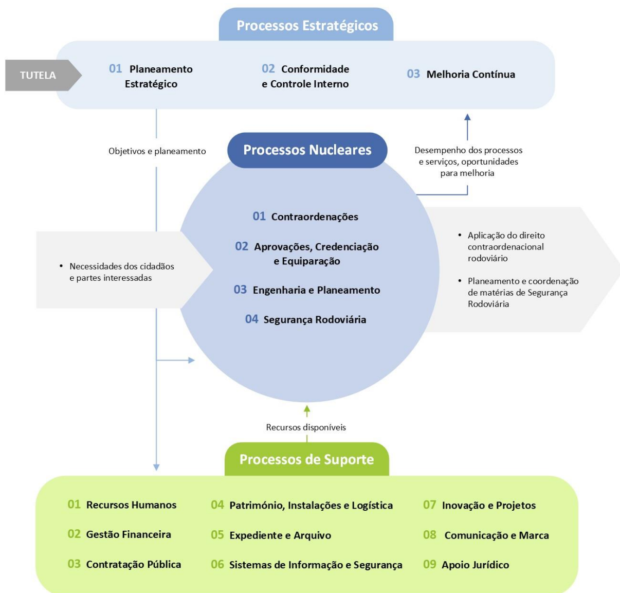
Figura 3. Mapa de Processos da ANSR

Com o intuito de garantir uma gestão por processos mais eficaz, foram definidos subprocessos, nos processos considerados mais amplos e complexos, resultando no seguinte Mapa de processos: